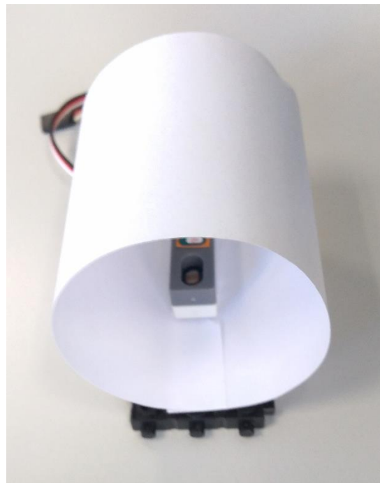
2. Мишень в сборке

Для создания мишени используйте: полосу бумаги 21x7 см, датчик света и блоки 5x11. бумага используется для экранирования датчика от постороннего света и рассеивания лазерного луча.