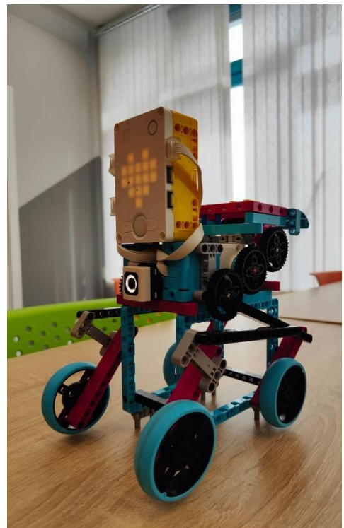
Рисунок 2, вид с правого бока