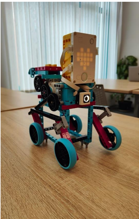
Рисунок 1, вид с левого бока

При создании нашего проекта мы пользовались следующими источниками: https://spike.legoeducation.com/