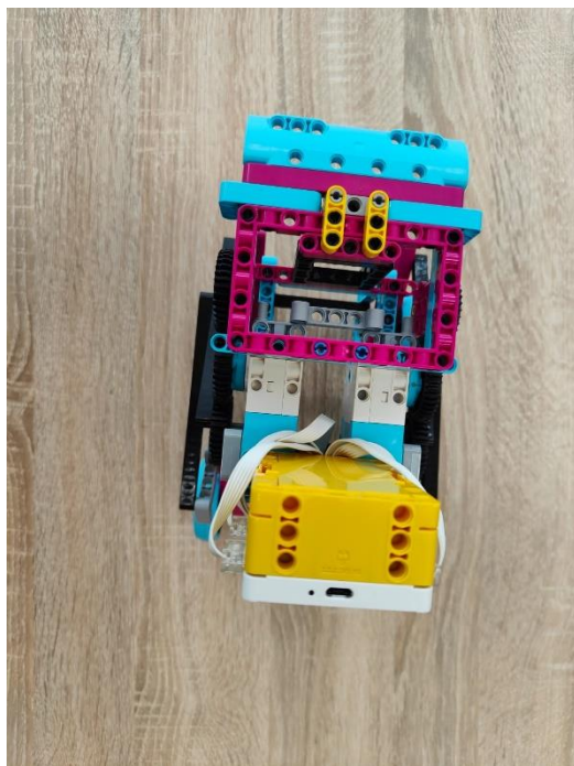
Рисунок 4, вид сверху