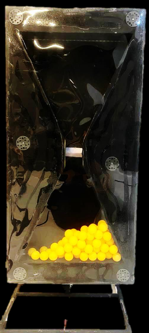
Робот «ПЕСОЧНЫЕ ЧАСЫ»